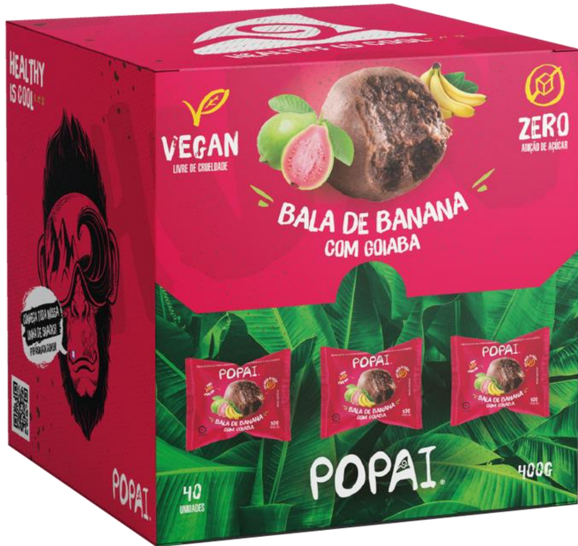
Display de 40 UND

Validade: 180 dias EAN: 7898962761908 EAN Display: 7898962761953 DUN: 17898962761950 Display com 40 unidades Caixa com 6 displays