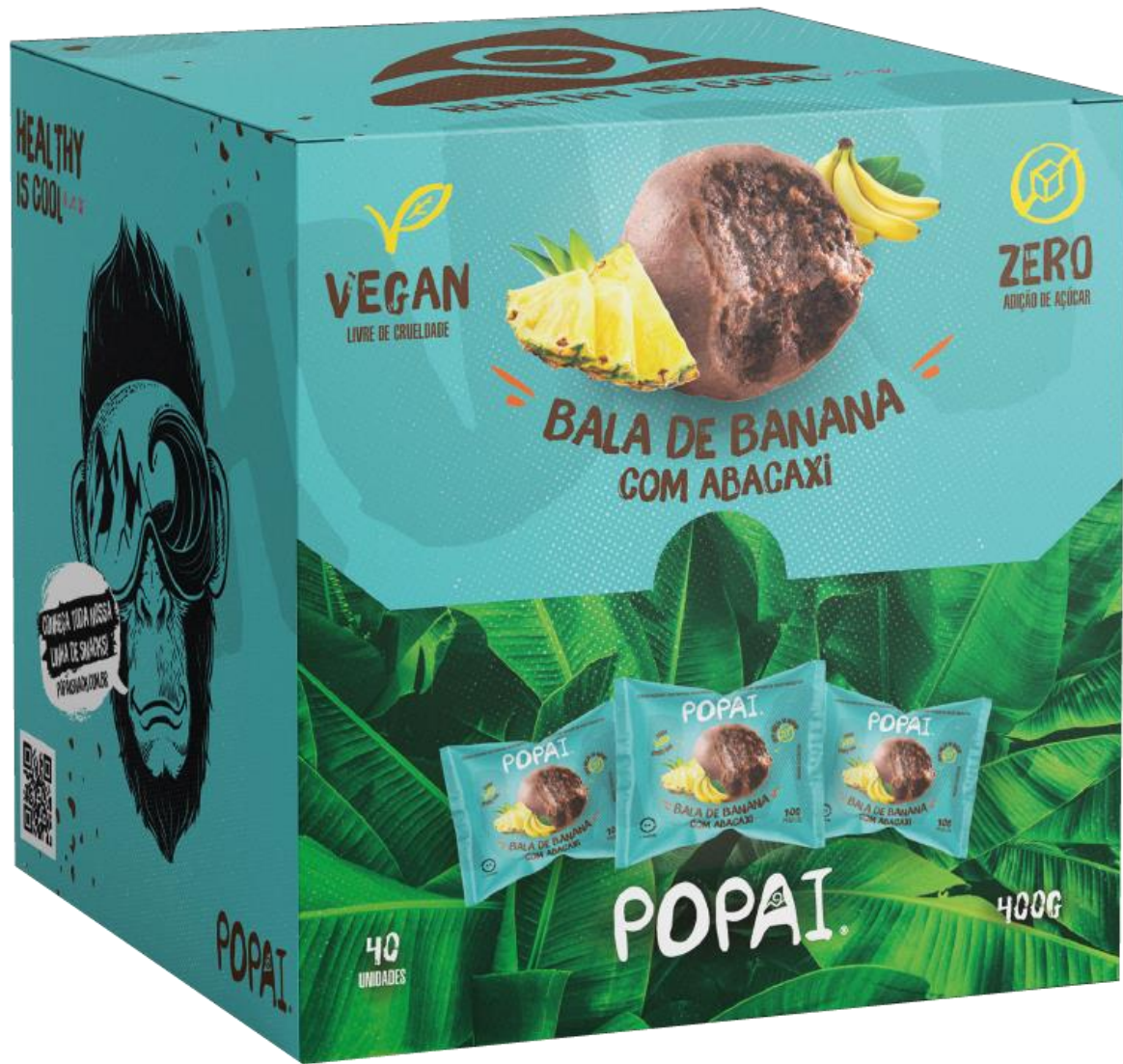
Display de 40 UND

Validade: 180 dias EAN: 7898962761915 EAN Display: 7898962761946 DUN: 17898962761943 Display com 40 unidades Caixa com 6 displays